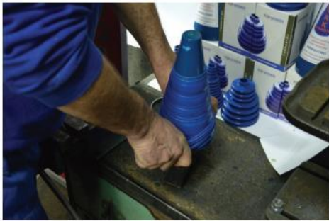
7. Manžetnu početi navlačiti na levak