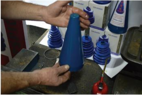
4. Namazati levak uljem ili tečnim silikonom