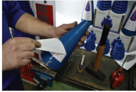
2. Skinuti nalepnicu sa levka