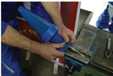
9. Prebaciti manžetnu preko HKZ na poluosovinu