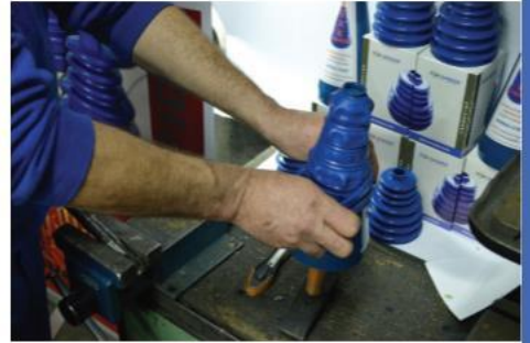
6. Manžetnu staviti na levak