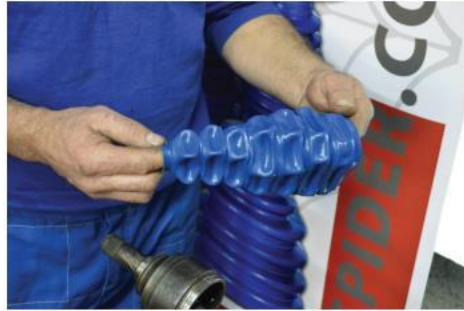
5. Manžetnu prevrnuti