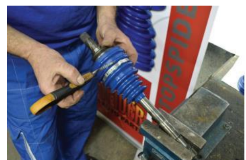
12. Iseći manžetnu na odgovarajuću dužinu