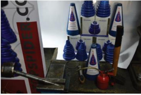
1. Alat koji je potreban za montažu: levak, čekić, ulje, sklaper