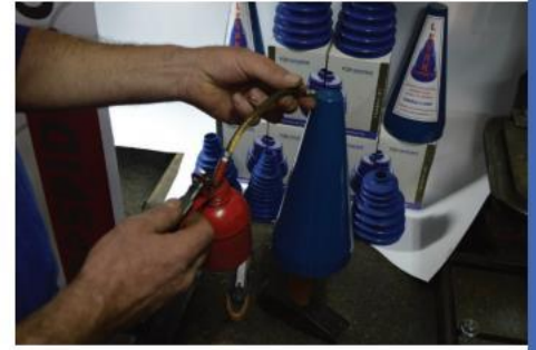
3. Levak staviti na čekić