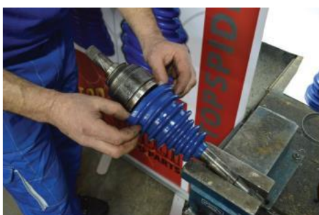
10. Manžetnu vratiti u prvobitno stanje